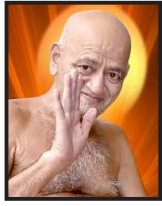
श्रद्धास्थान मुनीश्री विद्यासागरजी महाराज